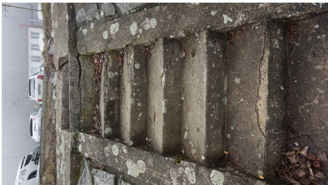
Obr. 29 Poškození schodiště