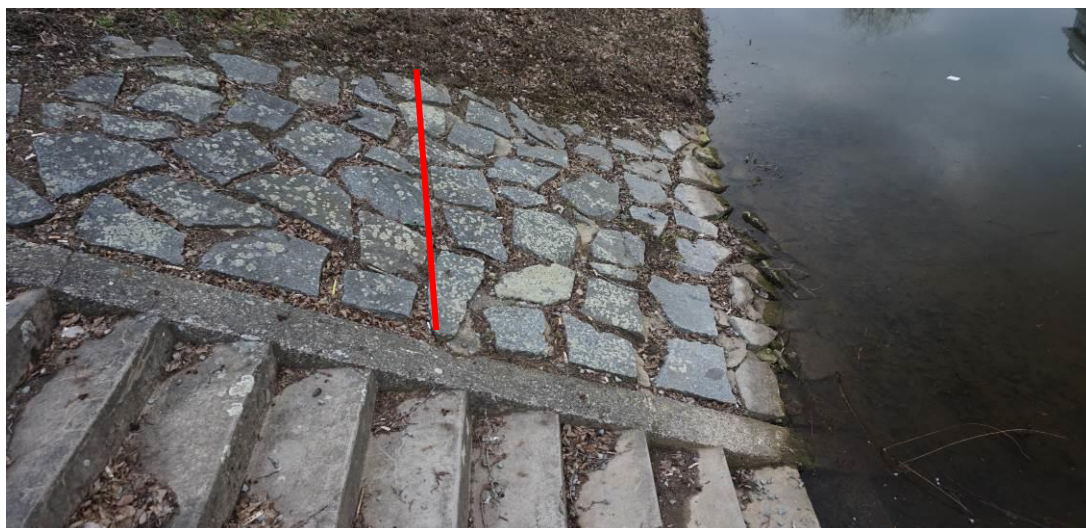
Obr. 12 Pohled od schodiště směrem od jezu, trhlina ve schodišti, linie opravy