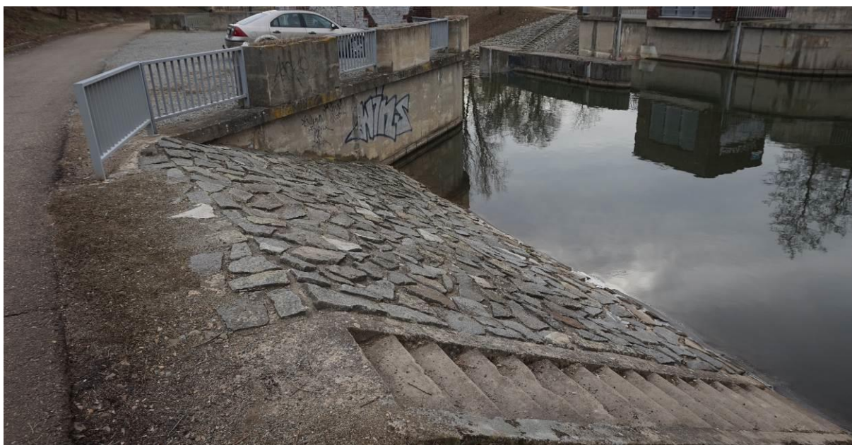
Obr. 3 Pohled shora