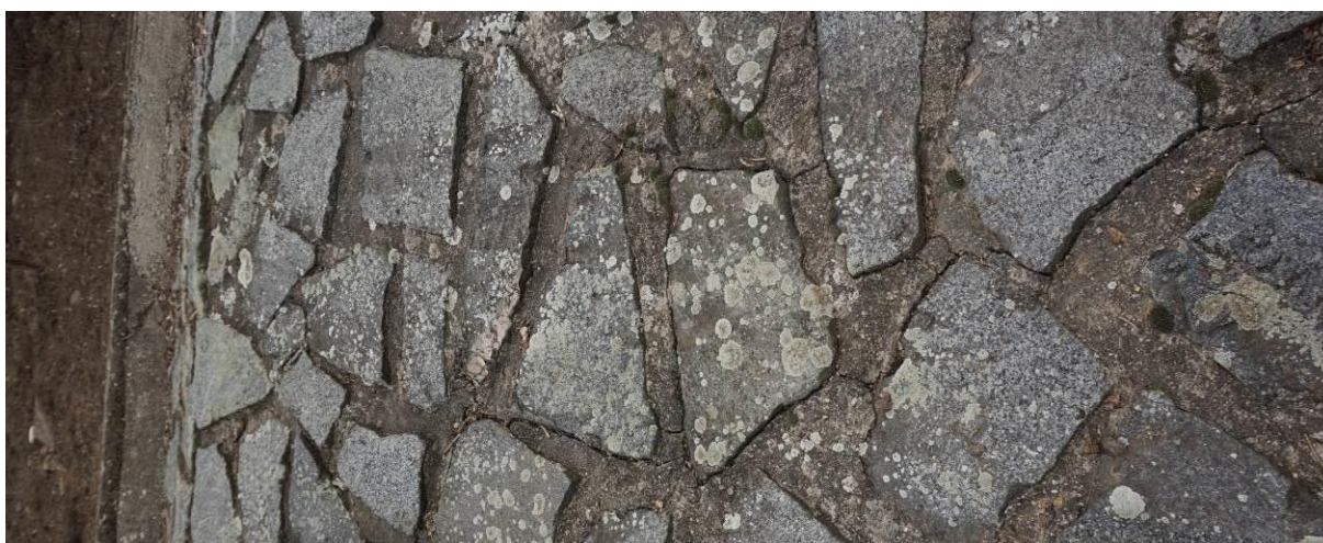
Obr. 21 Detail trhliny v horní části opevnění mezi prahem a schodištěm