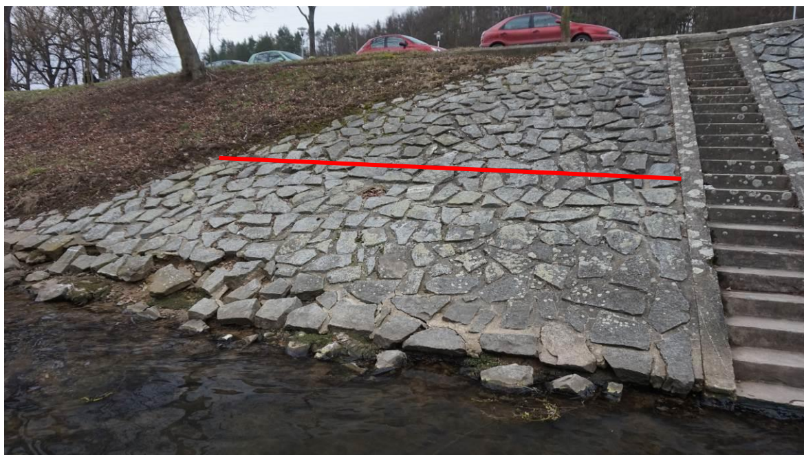
Obr. 25 Stav opevnění mezi schodištěm a koncem opevnění s linií opravy