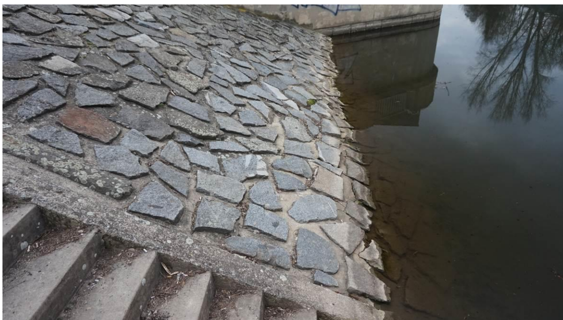
Obr. 4 Pohled od schodů směrem k jezu