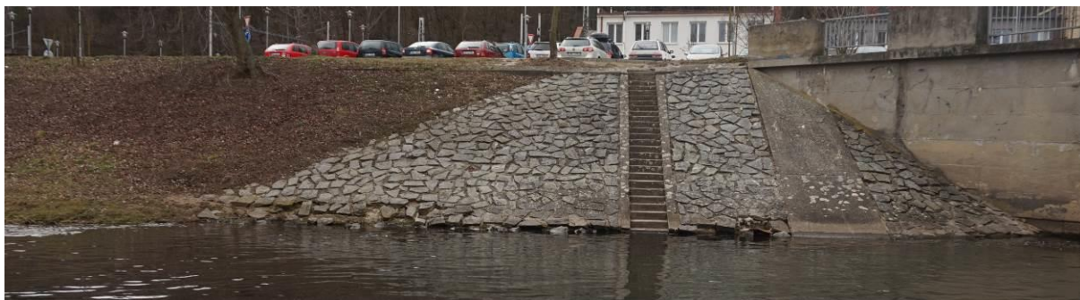
Obr. 22 Celkový pohled