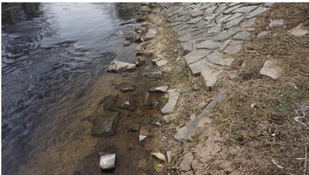
Obr. 19 Opevnění na konci, pohled směrem k jezu