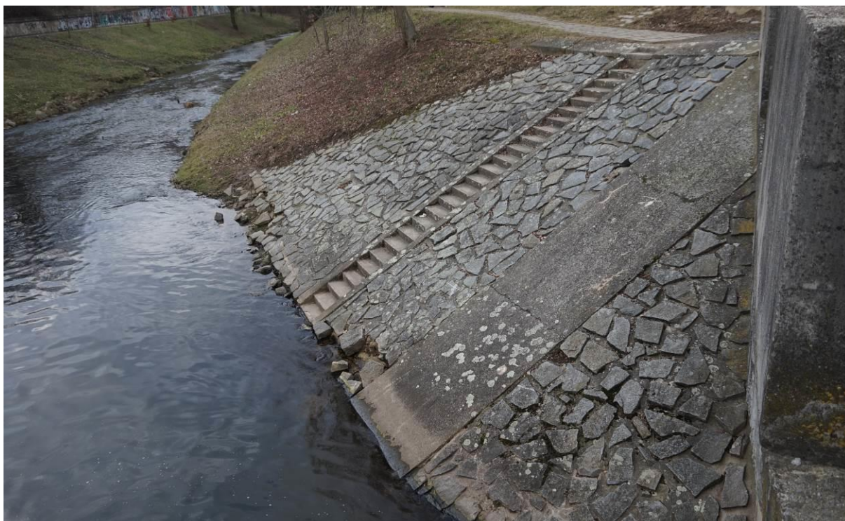
Obr. 23 Pohled směrem od jezu, trhliny v prahu