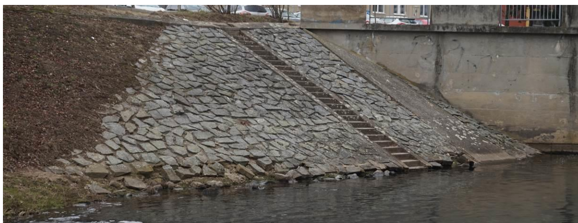
Obr. 26 Stav opevnění mezi schodištěm a koncem opevnění