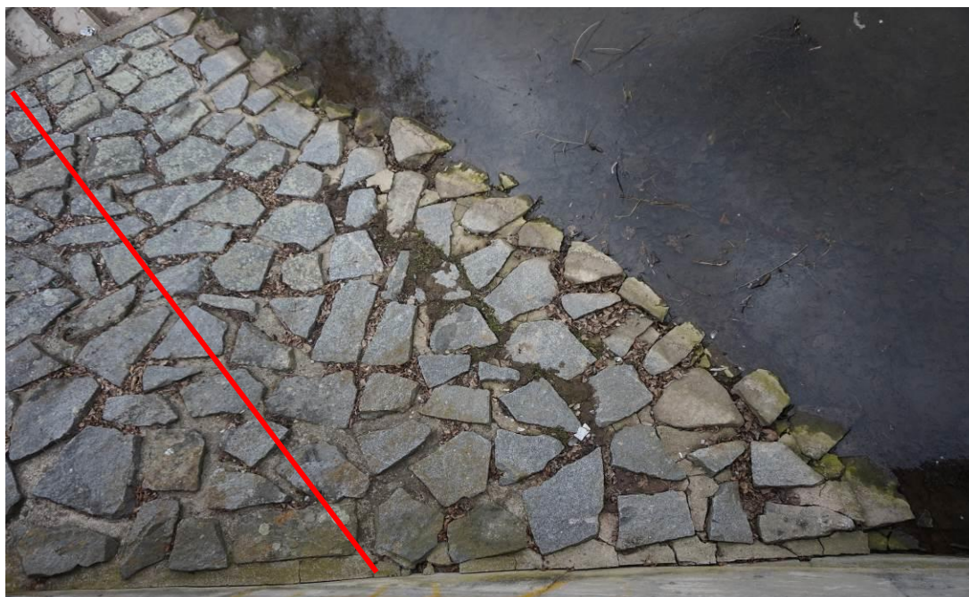
Obr. 11 Detail břehového opevnění a spáry podél nábrežní zdi s linií opravy