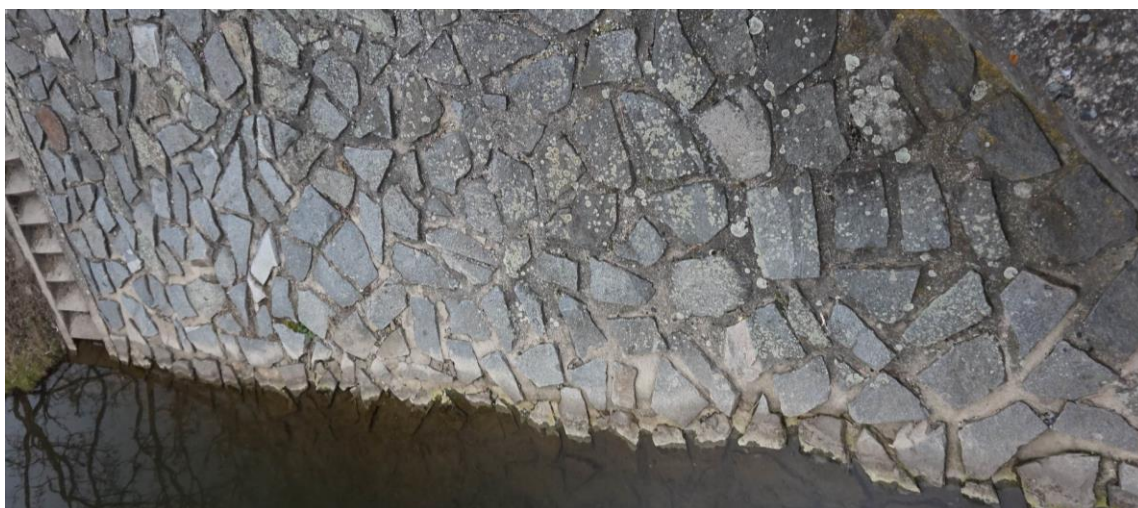
Obr. 6 Detail opevnění