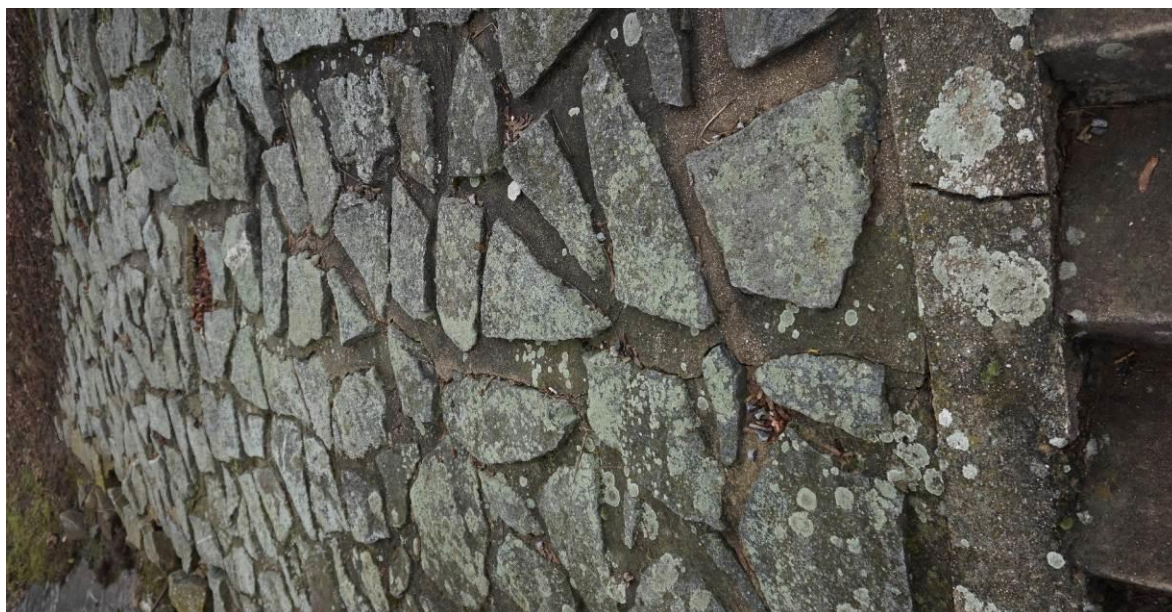
Obr. 27 Detail trhliny opevnění a schodiště, pohled směrem ke konci opevnění