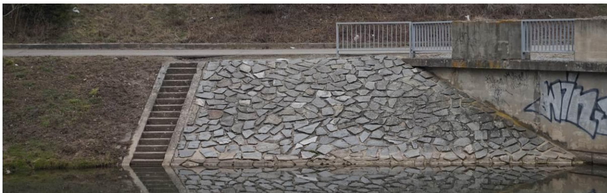
Obr. 1 Celkový pohled na břehové opevnění