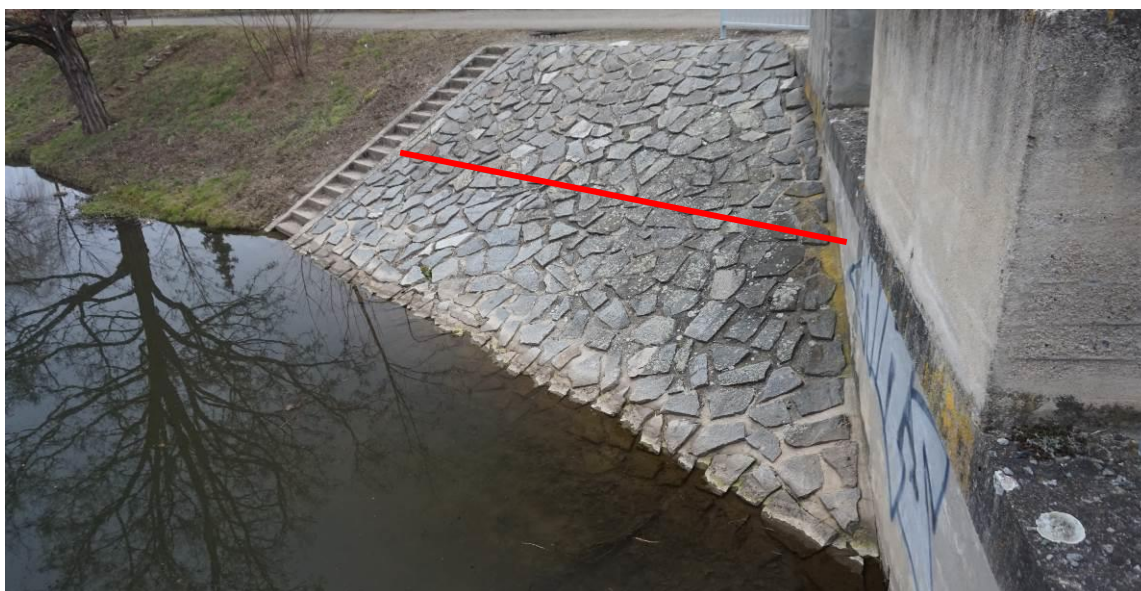
Obr. 5 Pohled směrem od jezu s linií opravy