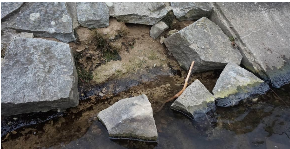
Obr. 28 Detail stávajícího opevnění u prahu