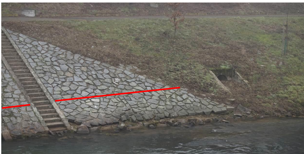
Obr. 17 Stav opevnění od výusti po konec opevnění, pohled od jezu, linie opravy