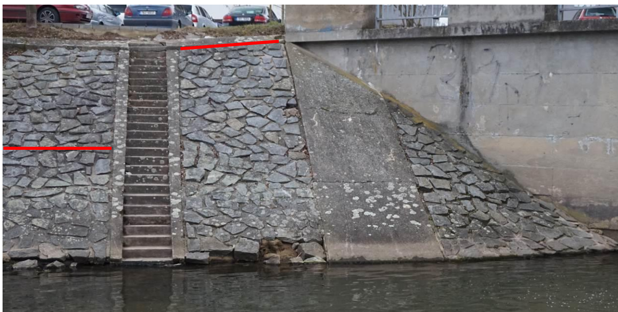
Obr. 24 Stav opevnění mezi prahem a schodištěm s linií opravy