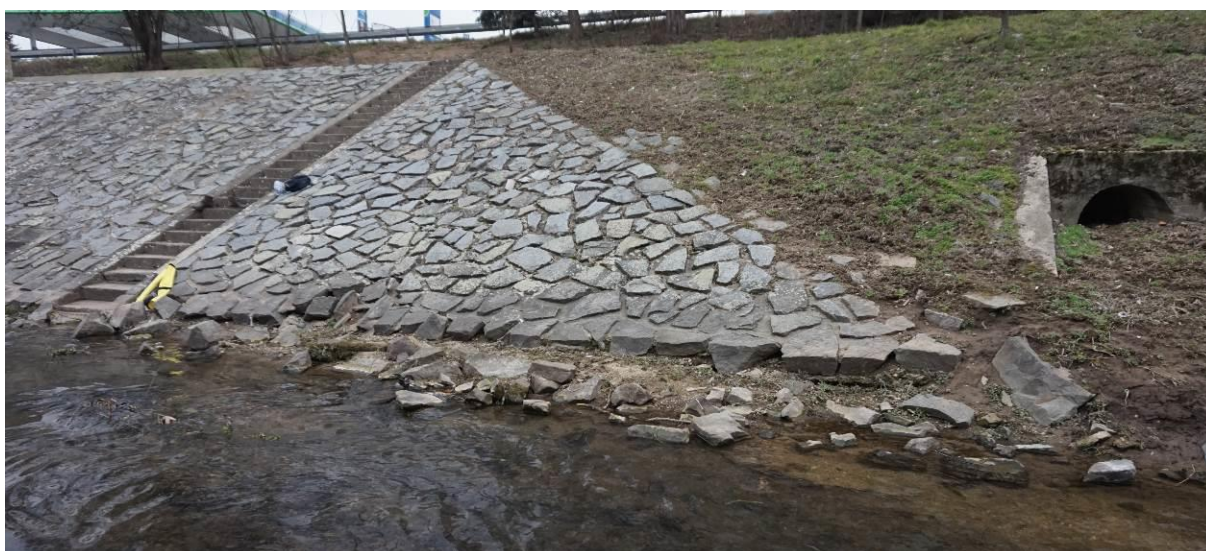
Obr. 20 Opevnění na konci, pohled směrem k jezu