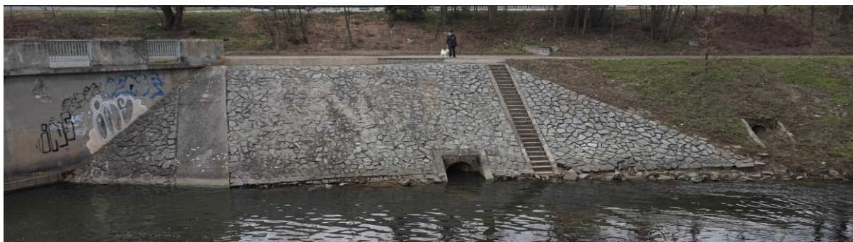
Obr. 13 Celkový pohled