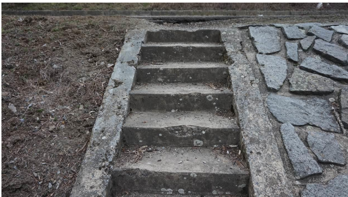
Obr. 2 Poškozené schodiště