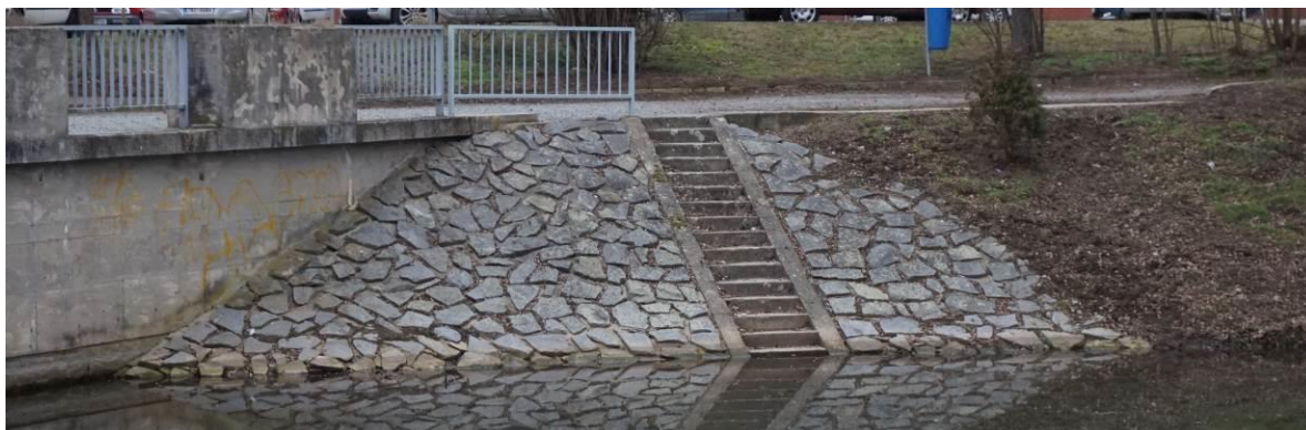
Obr. 7 Celkový pohled