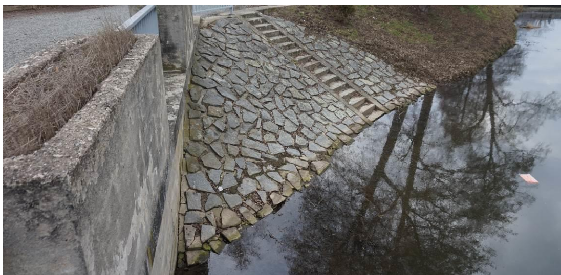
Obr. 10 Pohled směrem od jezu