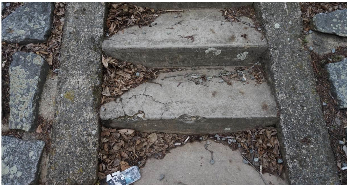
Obr. 8 Poškozené schodiště