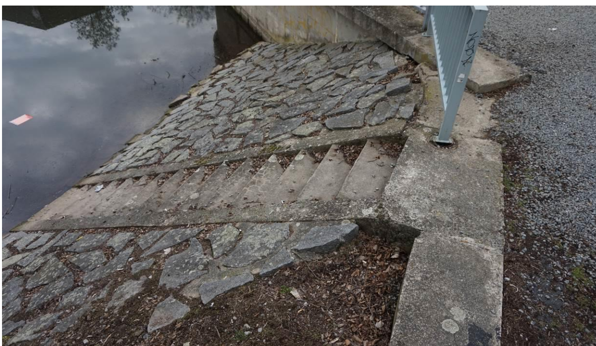
Obr. 9 Pohled shora