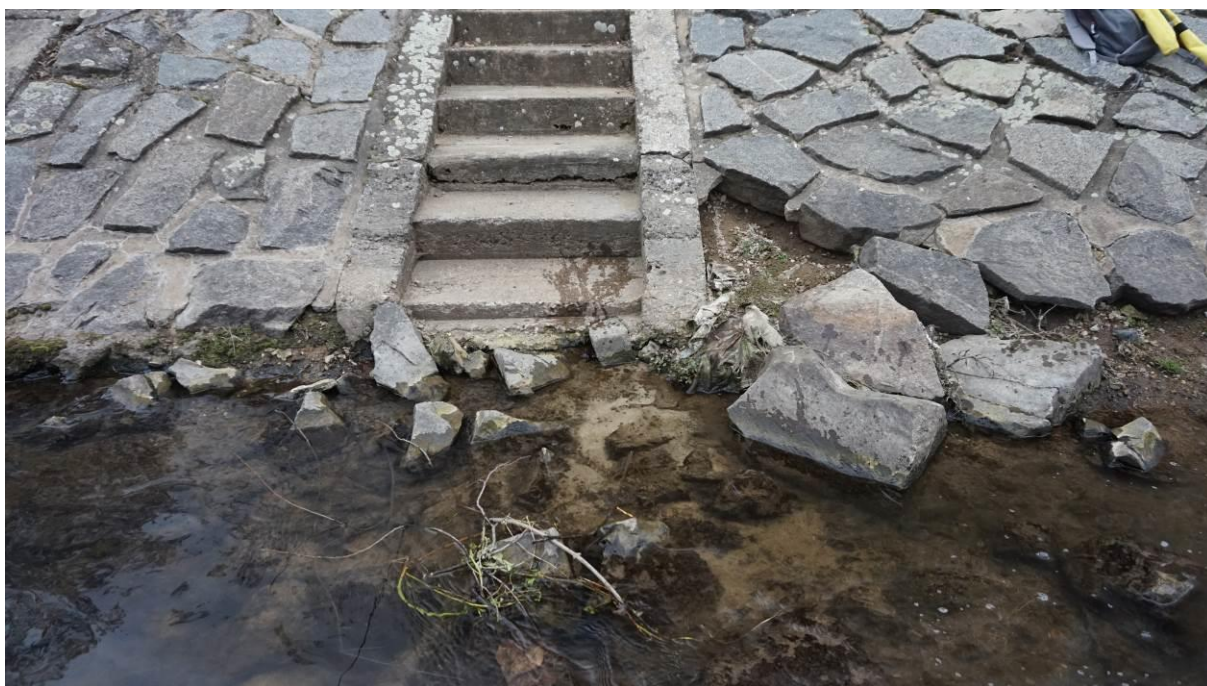
Obr. 16 Opevnění kolem schodiště