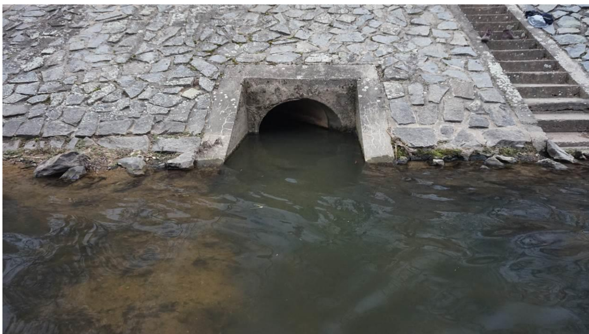
Obr. 15 Výmol ve dně a opevnění kolem výusti