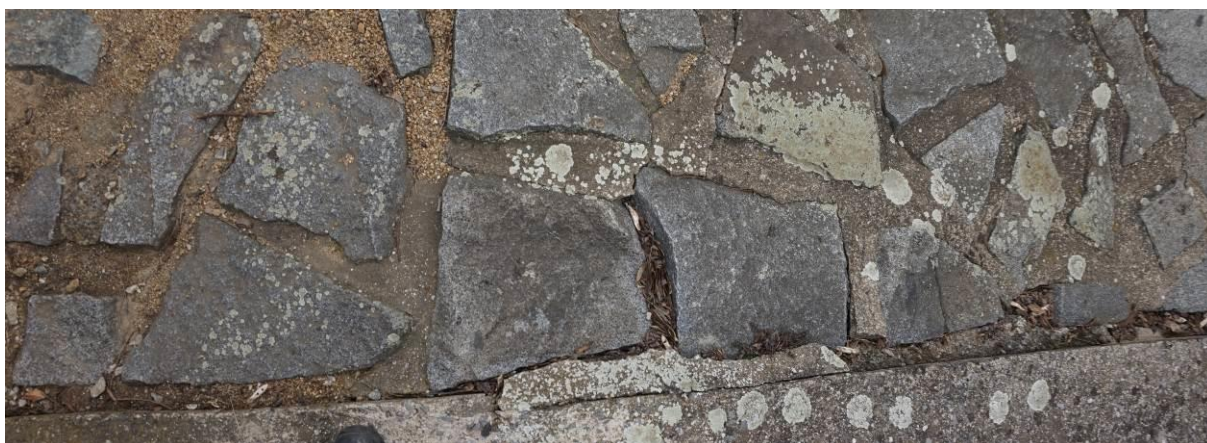
Obr. 18 Detail spáry mezi prahem a opevněním